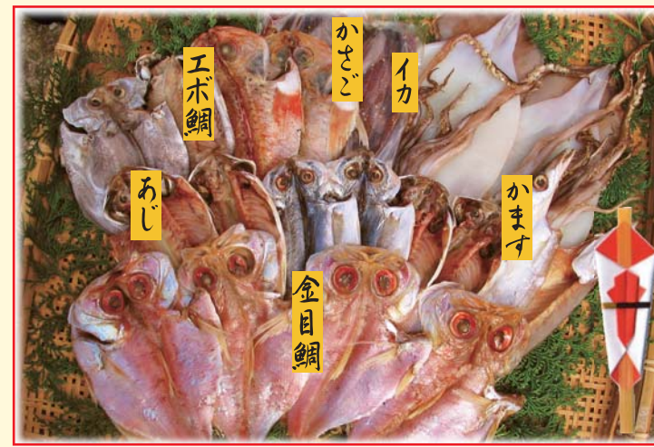
【A4】伊豆づくしセット 税込 5,000円 金目鯛4枚 / アジ6枚 / エボ鯛2枚 / カサゴ2枚 / カマス2枚 / イカ2枚