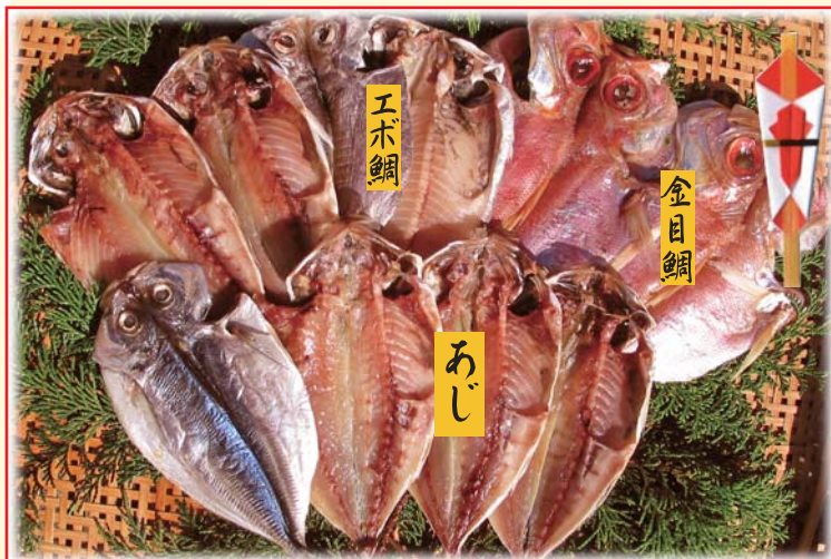
【A1】下田セット 税込 2,500円 金目鯛2枚 / アジ6枚 / エボ鯛2枚

金目鯛は、脂がのりご家庭でも焼きやすい小中サイズのみを厳選。アジ、エボ鯛、カマス、カサゴ等、伊豆おなじみの魚とのセットでご紹介致します。 創業58年 有限会社魚若