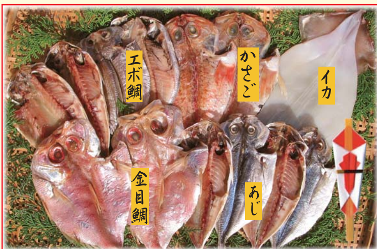
【A3】黒船セット 税込 3,700円 金目鯛2枚 / アジ6枚 / エボ鯛2枚 / カサゴ2枚 / イカ1枚