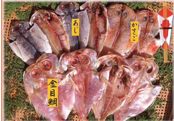
【A2】金目セット 税込 3,000円 金目鯛4枚 / アジ4枚 / カサゴ2枚